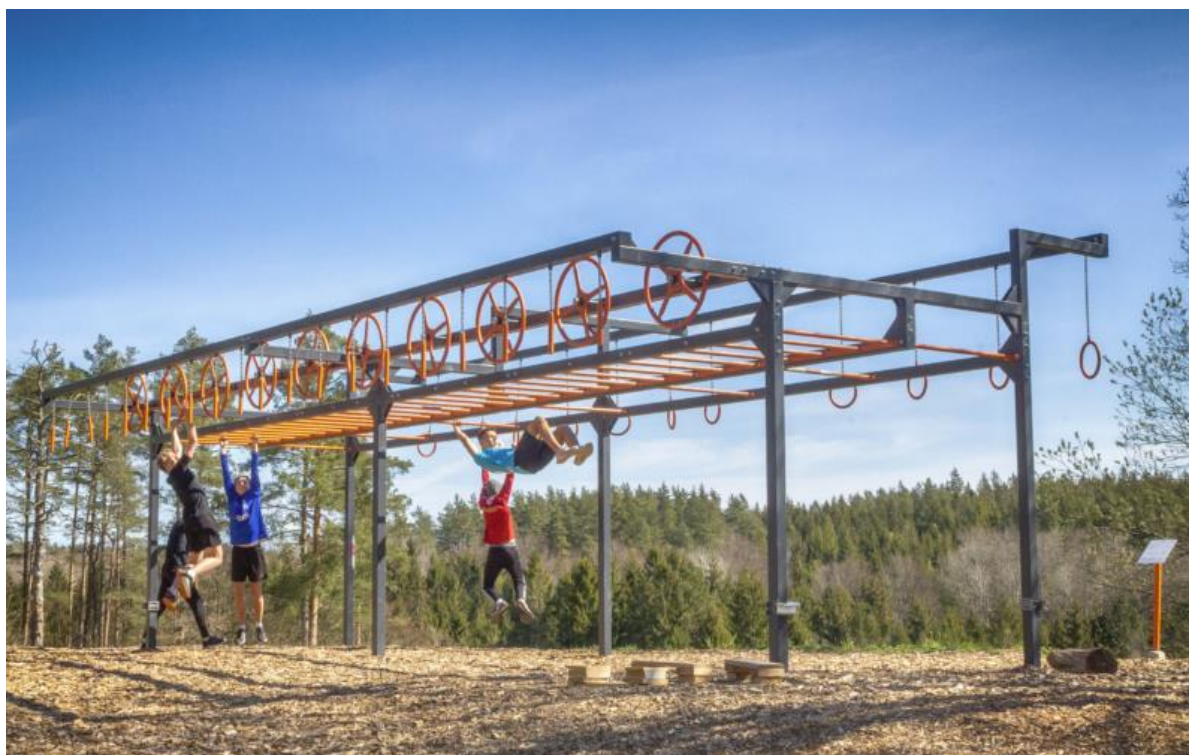
Exempel på hinder i en OCR-bana. Denna hämtad från Lingonbacken i Karlshamn 1

Målsättningen för aktiviteten är att väcka intresse för nya motionsformer både i skolan och på fritiden samt att öka elevernas rörelse och bidra till en bättre hälsa. Strömbackaskolan beviljades 654 tkr för denna aktivitet.